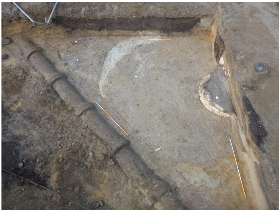
Figuur 1. De stadswaterput met daaromheen de insteek.