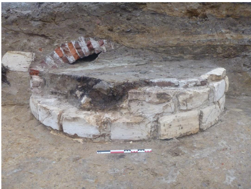
Figuur 2. De stadswaterput.