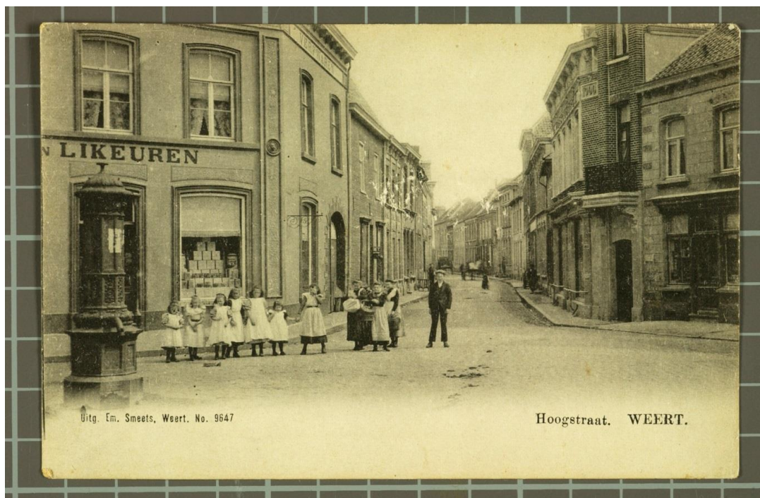
Figuur 3. De stadswaterpomp.